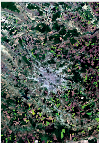
Culorile indică modul de utilizare a terenurilor:

Imaginile satelitare sunt imagini ale Terrei sau ale unor părți din aceasta, colectate de sateliți artificiali.